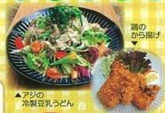
▲アジの冷製豆腐うどん